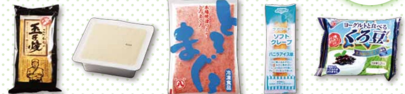
※写真は前回受賞商品より抜粋